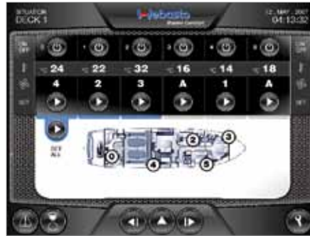
Maßgeschneidert für jede Yacht